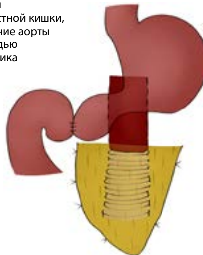
Рис. 2. Резекция двенадцатиперстной кишки, репротезирование аорты с укрытием прядью большого сальника

ния устойчивости к инфекции применяют протезы, импрегнированные серебром и обработанные антибиотиками, а также гомографты аорты [3].